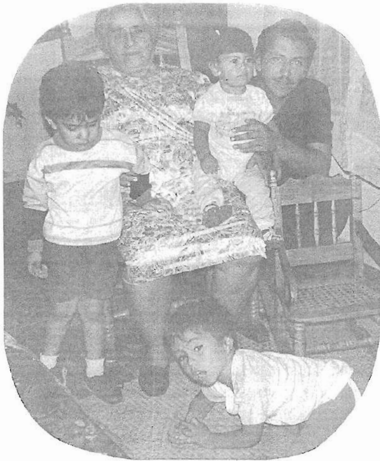
... mamá con 3 de sus nietos