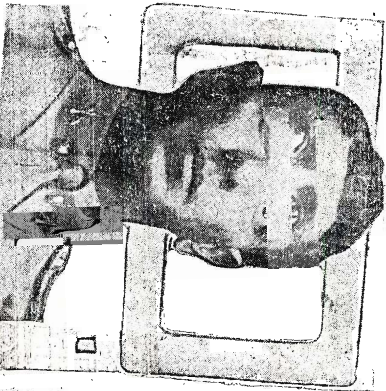
Capitán del Ejército mexicano Alfredo Ortega Belancourt , a quien se debe la iniciativa de fijar el 27 de abril de cada año como "Día del Soldado", conmemorando la acción del caso Damián, en Tepic, Jalisco, Querétaro.